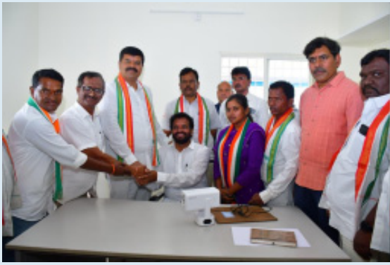
మణుగూరు, ఫిబ్రవరి 02 (భారతశక్తి): ప్రజా పాలనలో గ్రామీణ ప్రాంతాల అభివృద్ధి లక్ష్యమని పిన్ పాక నియోజకవర్గ

-విద్యుత్ శాఖ అభివృద్ధిలో మరో కీలక ఘట్టం -ఎలక్ట్రికల్ ఏడి కార్యాలయ నూతనభవనాన్ని ప్రారంభించిన ఎమ్మెల్యే పాయం