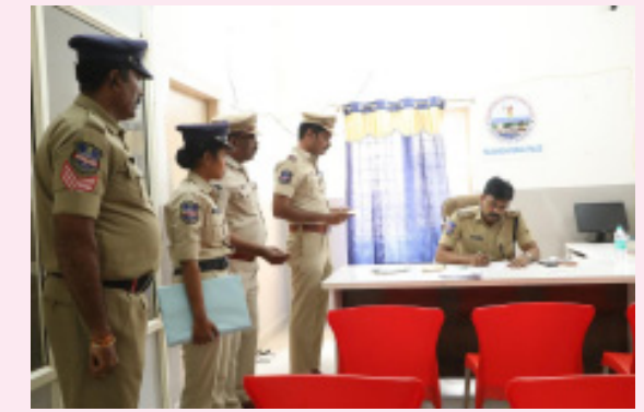
చేయాలని సూచించారు. అసాంఘిక కార్యకలాపాలకు పాల్పడే వ్యక్తులపై కఠిన చర్యలు తీసుకోవాలన్నారు. అనంతరం అక్కడ విధులలో ఉన్న సిబ్బంది నమస్కలను తెలుసుకొని వారి సందర్శనానికి కృషి చేస్తామని తెలియజేశారు. ఈ కార్యక్రమంలో పాల్వంచ సీబి సతీష్, ఎస్పీ శ్రీనివాస్, డీఐఎస్సీ అధికారులు, సిబ్బంది పాల్గొన్నారు.

భద్రాద్రి జిల్లా బ్యూరో, ఫిబ్రవరి 02 (భారతశక్తి): పోలీస్ స్టేషన్ పరిసరాలను ఎప్పటికప్పుడు పరిశుభంగా ఉంచుకోవాలని ఎస్పీ రోహిత్ రాజు సూచించారు. సోమవారం పాల్వంచ రూరల్ పోలీస్ స్టేషన్ ను ఎస్పీ ఆకస్మికంగా సందర్శించారు. ముందుగా ఓ అమలులో భాగంగా పోలీస్ స్టేషన్ రికార్డులను ఒక క్రమ వద్దతిలో అమర్చుకోవాలని తెలిపారు. అనంతరం పోలీస్ స్టేషన్ రికార్డులను పరిశీలించి, వలు కేసుల వివరాలను అడిగి తెలుసుకున్నారు. వర్దికల్ వారిగా పోలీస్ స్టేషన్లో విధులు నిర్వహించే అధికారులు, సిబ్బంది పనితీరును పరిశీలించారు. ఈ సందర్భంగా పోలీస్ స్టేషన్లోని అధికారులు, సిబ్బందికి పలు సూచనలు చేశారు. దయలో 100 ఫోన్ రాగానే స్పందించి ఘటనా స్థలానికి చేరుకొని బాధితులకు న్యాయం చేకూర్చాలని సూచించారు. పోలీస్ స్టేషన్ పరిధిలో ఎక్కువగా రోడ్డు ప్రమాదాలు జరగకుండా ప్రజలకు అవగాహన కల్పిస్తూ ప్రమాద నివారణా చర్యలు చేపట్టాలని తెలిపారు. సైబర్ నేరాల బారిన పడకుండా ఎప్పటికప్పుడు ప్రజలను అప్రమత్తం